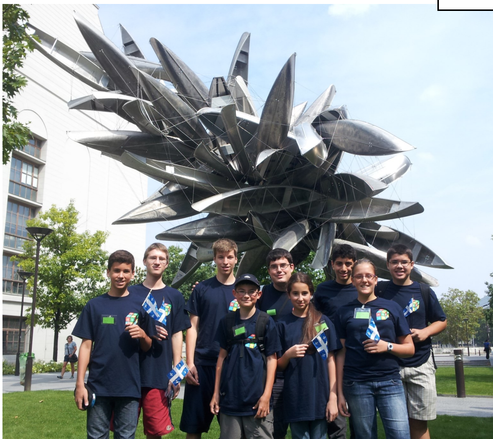
Délégation du Québec à Paris, août 2013