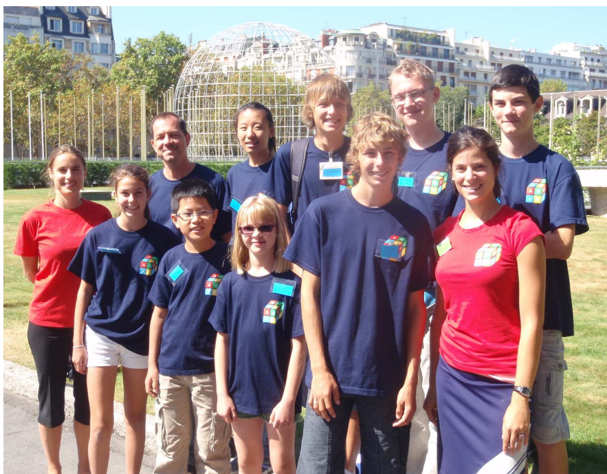
Délégation du Québec à Paris, août 2012